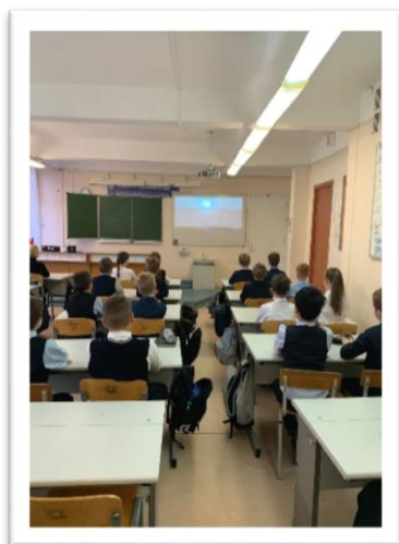
5 «М» класс